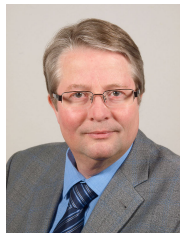
Bernd Bornemann Oberbürgermeister der Stadt Emden