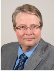
Bernd Bornemann Oberbürgermeister der Stadt Emden