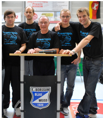
Ein Teil des Turnier-Organisationsteams der vergangenen Jahre

Seit dem Jahr 1992 richten wir regelmäßig Landesveranstaltungen aus und verfügen über ein erfahrenes Turnierteam. Zunächst mussten wir für Turniere noch in städtische Sporthallen ausweichen. Seit der Fertigstellung der vereinseigenen Dreifachhalle im Jahr 2000 können wir in unseren „eigenen vier Wänden“ Turniere durchführen und richten in fast jeder Spielzeit eine Landesveranstaltung aus. Ein Highlight war im Jahr 2011 der Deutschlandpokal der Jungen — hier sind wir mit einem großem organisatorischen Aufwand in eine städtische Fünffachhalle umgezogen.